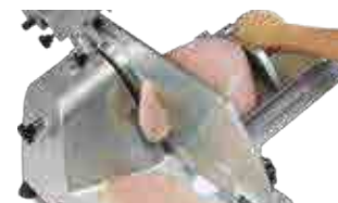
Cuchilla de acero al cromo duro

SERVICIO Y REFACCIONES DISPONIBLES Contamos con una red de centros de servicio en toda la república: rhino.mx/servicio.html